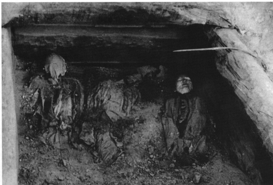
Ил. 1. Оглакhtинская гробница после снятия перекрытия. Фото Л. Р. Кызласова, 1969 г.

подложенная под плечи мужчины детская шубка из меха овцы с оторочкой из шкурок соболя и мешочек из меха колонка* [Никитина, Баранова, 1973; Баранова, Никитина, 1974; Дары Эрмитажу, 1989; Frozen Tombs, 1978, р. 94—96, 100]. На женщине была надета овчинная шуба со стоячим воротником. Сохранились остатки шапки и меховых штанов. Нашлась и сложная женская коса, заплетенная из четырех прядей. Женская маска многократно издавалась сотрудниками Эрмитажа [Новые поступления Эрмитажа, 1977, с. 110—111; Дары Эрмитажу, 1989, с. 75—77; Artamonov, 1974].