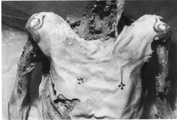
Ил. 3. Татуировки на плечах и груди погребенного мужчины

один из внутренних отростков сплошной, а другой (расположенный ближе к груди мумии) раздвоен посередине, с просветом чистой кожи. Нижние части рисунков, видимо, тоже были асимметричны. Как видно на фигуре на правом плече, ее внешний край сплошной, а внутренний разделен на три дугообразные части. Сохранившиеся фрагменты фигур имеют размеры около 7,0 \times 4,5 см.