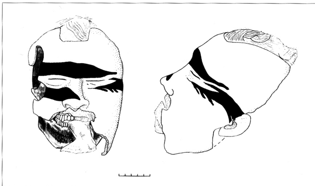
Ил. 2. Раскраска мужской погребальной маски. Рисунок Л. Р. Кызласова, 1969 г.

жено «головой» на подушку из замши (30,0 × 19,0 см), рядом с которой положили кожу, снятую с его головы перед сожжением тела.