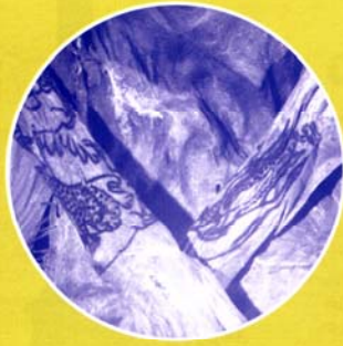
Высокая стройная женщина из Пятого Пазырыкского кургана была, должно быть, красавицей. Ее руки ниже локтей украшены сценами борьбы животных, а на пальцах изображены бутоны лотосов

сохранилась благодаря сухой песчаной почве и герметичности погребального сруба, обернутого берестой. Именно с ней оказалось связано новое открытие татуировок, появившееся за собой другие находки.