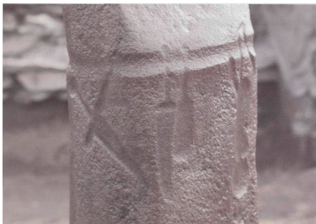
Рис. 4. Чинге-Тэй I. Олений камень. Деталь

Еще один олений камень найден в секторе АРС при разборке камней кром-леха кургана. Небольшая прямоугольная в сечении стела (длина 0,8 м, размеры в верхней части 0,3×0,2 м, в основании 0,2×0,2 м) была уложена лицевой стороной вниз, верхней частью в вос-