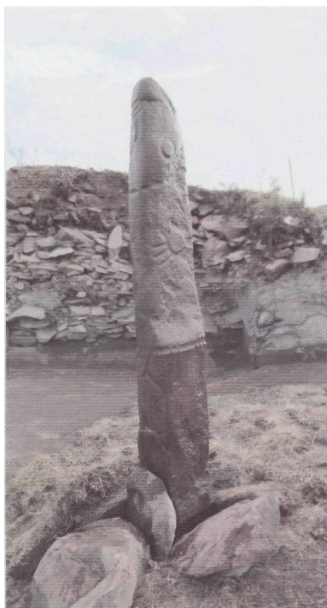
Рис. 3. Чинге-Тэй I. Олений камень из сектора АБВ. Общий вид

границы камня скруглены. Верхняя зона включает изображения трех косых линий, серьги с конусовидным выступом на боковых гранях. В средней зоне с левой стороны располагается выбивка, которую можно трактовать как изображение ладони с растопыренными пальцами и кругом (зеркало?). На поясе олений камня выбивкой показаны: на лицевой грани — кинжал, слева - горит, оселок, нож (рис. 4); с правой стороны - чекан. Кроме изображения руки, олений камень имеет еще одну редкую деталь - на лицевой стороне под тремя чертами находится продолговатый выступ, который, вероятно, должен был обозначать нос антропоморфной фигуры. Ожерелье из девяти овальных ямок имеет на задней грани застежку, показанную круглым звеном (рис. 7.-1). Техника выбивки изображений точечная с последующей шлифовкой.