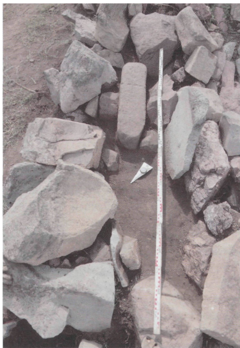
Рис. 5. Чинге-Тэй I. Сектор АРС. Оленный камень в кромлехе