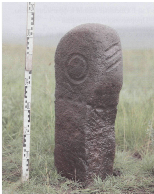
Рис. 6. Чинге-Тэй I. Оленный камень из сектора АРС. Общий вид

точном направлении (рис. 5). На сознательное размещение изваяния в этом месте указывает то, что оно лежало параллельно вертикальным камням кромлеха под тремя плитами точно напротив одного из воинских захоронений (могила 4).