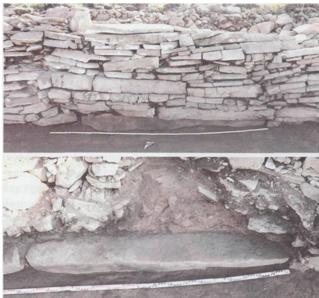
Рис. 2. Чинге-Тэй I. Сектор АБВ. Олений камень в основании стены