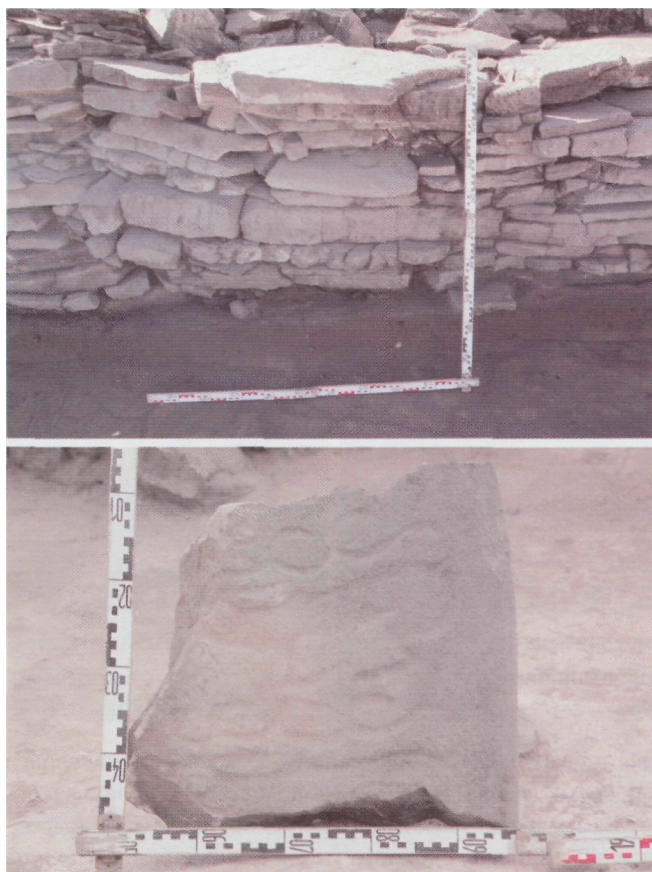
Рис. 1. Чинге-Тэй I. Сектор АБВ. Фрагмент оленного камня из фасадной кладки стены

и массивные плиты. Некоторые из них на момент разборки оказались сильно фрагментированными, вероятно, в результате давления на них тяжелой техники (верх наземного сооружения в этом секторе сильно поврежден позднейшими выемками). При разборке кладки и расчистке лежавшей стелы выяснено, что крупные камни сложены регулярно только по линии фасада стены, а за ними располагаются без видимого порядка камни и плиты различных размеров, смешанные с красноватым материковым суглинком и щебнем (рис. 2).